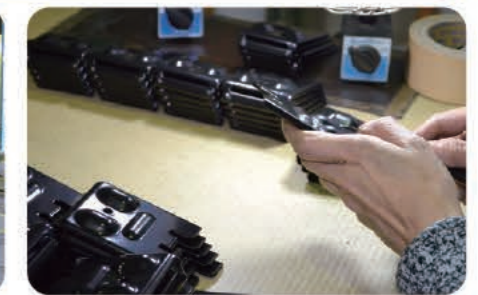
コーティング製品の外観最終チェック