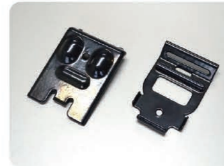
コーティング製品(PA・PE)