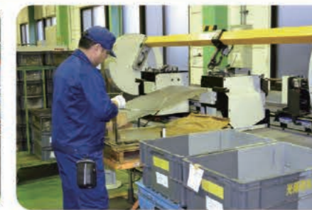
出来上がったワイヤー製品の検品作業