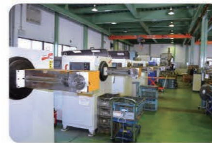
ワイヤー曲げ加工用のNCフォーミングマシン